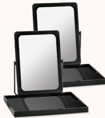
Dos espejos con bandejas