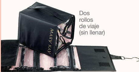
Dos rollos de viaje (sin llenar)

Y gana el crédito en efectivo de Impulsores de negocios por $50 en productos al mayoreo**.