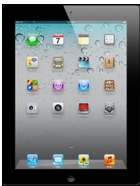
IPAD 3 is a prize for either court!